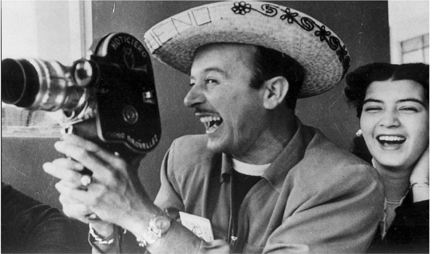
Pedro Infante es considerado el mas grade de los actores de la epoca de oro del cine mexicano. Fotografía de archivo.

D urante la Segunda Guerra Mundial la industria cinematográfica mexicana, apoyada por Estados Unidos, prosperó en forma notable. De 1941 a 1945, aproximadamente, el cine mexicano conoció la que después fue llamada "Época de Oro". En esta, surgieron varias compañías productoras, como Filmex, Films Mundiales, Posa Films, Rodríguez Hermanos y la asociación de Bustillo Oro y Grovas. Este ambiente cultural favoreció el surgimiento de una nueva generación de directores, entre los que destacaron Emilio "el Indio" Fernández y Fernando de Fuentes.