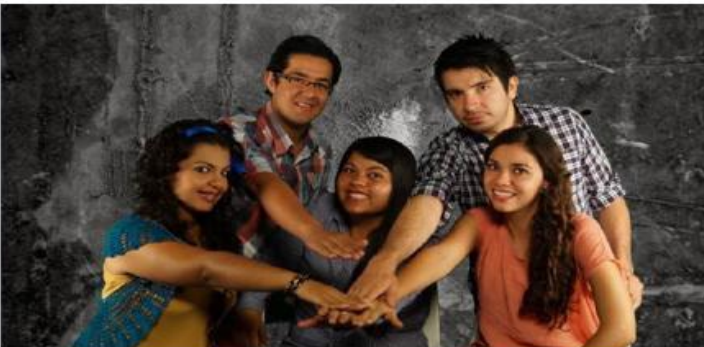
Imagen donde se le aplicó la llave de color y se utilizó un fondo distinto al de la pantalla verde.