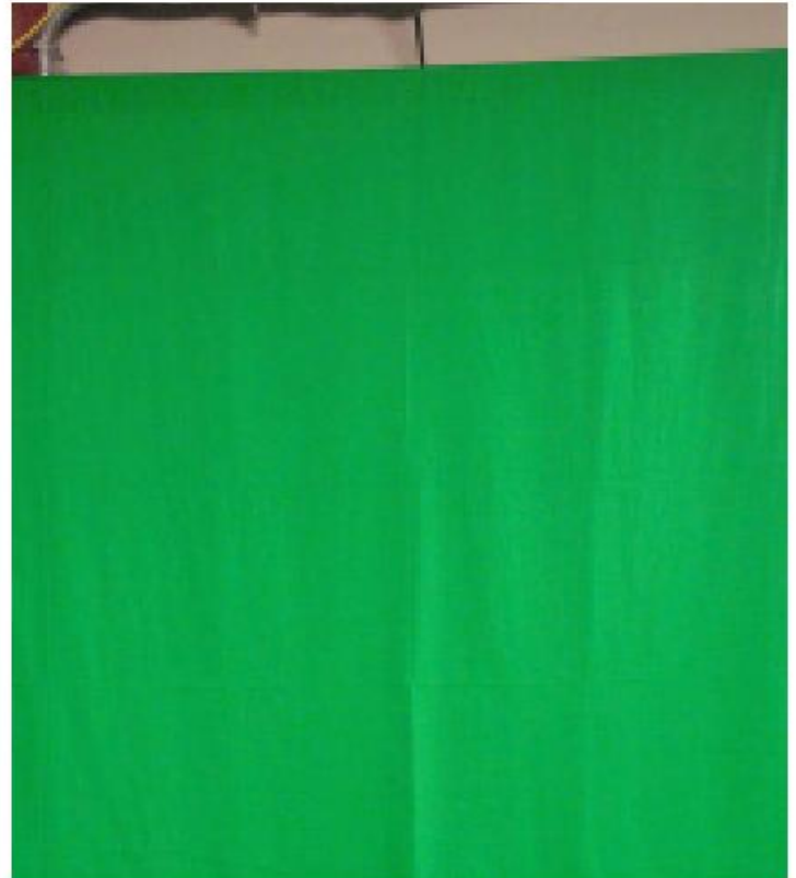
forillo: (fondo de tela montado en un bastidor)

“Con la Llave de color, reduces los gastos que implica rodar al personaje en un escenario real”