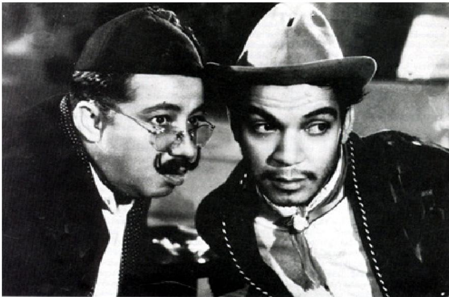
Cantinflas fue considerado por el mismísimo Charles Chaplin como el mejor comediante del mundo.

En esos años, la conjunción perfecta de una industria, excelentes realizadores y un talentoso cuadro de estrellas permitió la producción de un cine de gran calidad y éxito comercial. Prueba de ello es que más de la mitad de las seleccionadas entre las 100 mejores películas del cine mexicano corresponden a aquellos años dorados.