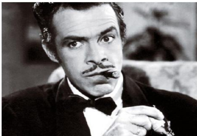
Tin Tan fue uno de los mejores comediantes de aquellos tiempos, por lo cual fue elegido para aparecer en la portada del disco Sgt. Pepper Lonely Hearts Club Band de los Beatles, aunque no sale en la edición final.

En 1957 dejaron de funcionar dos de los cinco estudios cinematográficos existentes: los Tepeyac y los Clasa, en 1958 los Azteca, todo esto es síntoma claro de que el cine mexicano dejaba atrás su gloriosa Época de Oro, de auge económico, de cantidad y calidad.