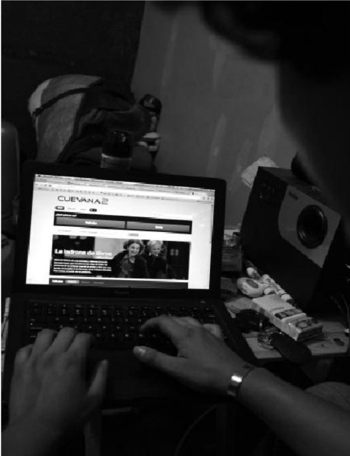
Cuevana, Mega, Repelis.TV, Taringa, entre otras, son los sitios más populares de películas gratuitas en la web.