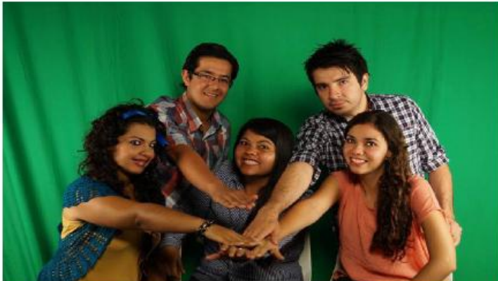
Imagen con pantalla verde, antes de cromar.